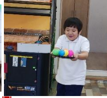
みんなで団結！！一生懸命頑張りました 🌟